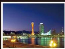
メリケンパーク Meriken Park

中華料理店や食材店、雑貨店などが、ところ狭しと軒を連ねる中華街。東の長安門、西の西安門、南の海菜門、南京町広場の東屋など中国式の建築物も素晴らしい。