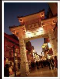
神戸中華街(南京町) China town

“The Sea Way” in Italian. business, you will be assured of a refreshing Hotel VIA MARE Kobe.